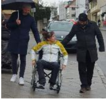
2023/24 Begehung Perspektivwechsel