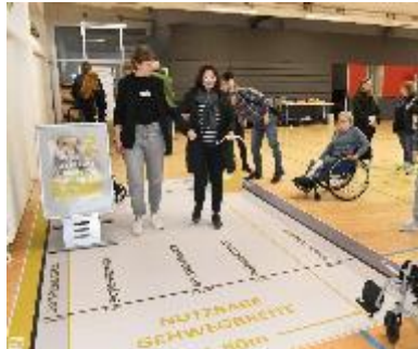
2024 Onlinebeteiligung und Bürgerforum Fußverkehrskonzept