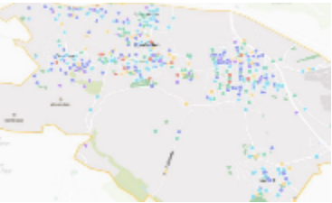
2025 Beschluss Fußverkehrskonzept