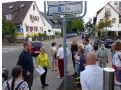
2019 Fußverkehrs- checks